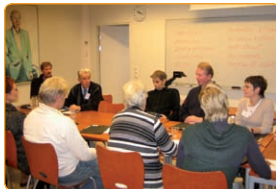
Gruppdiskussionen tar fart.

Eftersom detta var ett vetenskapligt experiment ville man se vilken inverkan olika sätt att göra beslut hade. I hälften av grupperna gjordes beslut genom slutna omröstning och andra hälften gjordes ett gemensamt ställningstagande. Det fanns inget krav på konsensus, om grupperna inte lyckades nå konsensus kunde de inkludera olika åsikter i ställningstagandet. Det betonades att grupperna skulle försöka hitta ”meta-konsensus”, dvs. konsensus vad gäller värderingar och övertygelser. Enligt undersökningsresultaten fanns det inget grupptryck, inte ens i grupperna som gjorde ett gemensamt ställningstagande och diskussionerna var deliberativa under hela medborgardiskussionen.